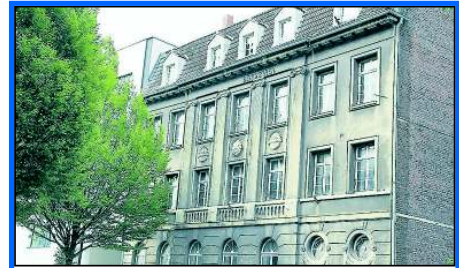
Eine Ruine des Landes: das alte Bergrevieramt.