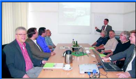
Die Hermer FDP vor Ort, hier bei der HCR.