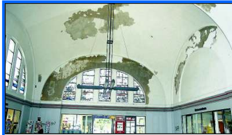
Von der Deutschen Bahn vernachlässigt: der Hermer Bahnhof.