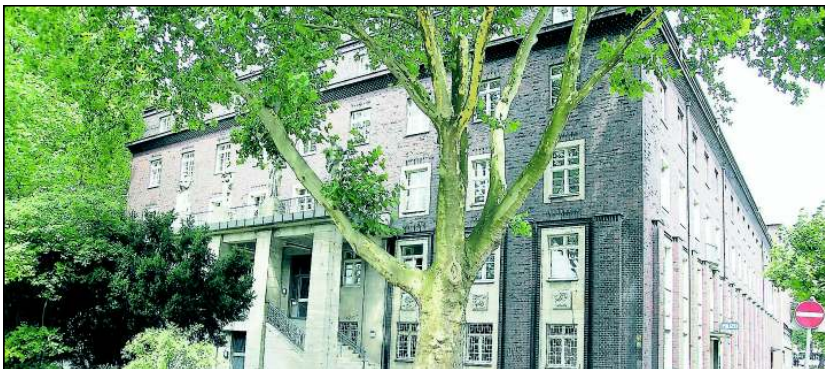
Was passiert mit dem alten Backsteingebäude, falls die Polizei hier auszieht? fragt sich nicht nur die Herner FDP.

Ohne Vorwarnung oder gar Rücksprache mit den rot-grünen Freunden vor Ort hat die Landesregierung das geplante Justizzentrum gestoppt. Was wird aus dem Hafthaus? Keine Antworten. Dafür soll Herne auch noch ein anderes Problem des Landes lösen und das in die Jahre gekommene Polizeigebäude in Herne übernehmen. Rot-Grün lässt Herne hängen und im Regen stehen.