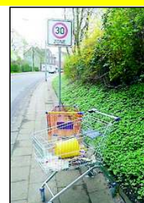
Hässlicher Anblick: wahllos abgestellte Einkaufswagen.

In der letzten Sitzung der Bezirksvertretung Herne-Mitte machte der Liberale Klaus Fußmann auf ein besonderes Argernis aufmerksam: geklaute und wahllos abgestellte Einkaufswagen, die das Stadtbild verschandeln. Zuständig für die Beseitigung ist die Verwaltung, so erfuhr er, nur für den öffentlichen Raum. Für Privatgrundstücke haben die Eigentümer die Verantwortung. Das Beispiel-Foto entstand an der Von-der Heydt-Straße (Bereich Pratorf).