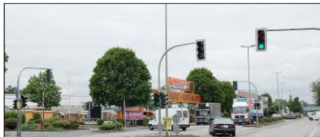
Ein Kreisverkehr an der „Hornbach“-Kreuzung (Süd-/Bochumer Straße) könnte helfen, den Verkehrsfluss zu optimieren.

„Ob das Thema nach dem Aus des Justizzentrums überhaupt noch aktuell ist, steht jedoch nach Auffassung der FDP-Fraktion in den Sternen. Alles steht und fällt mit dem BLB“, so Thomas Bloch. „Lassen wir uns überraschen ob und wie es weitergeht.“