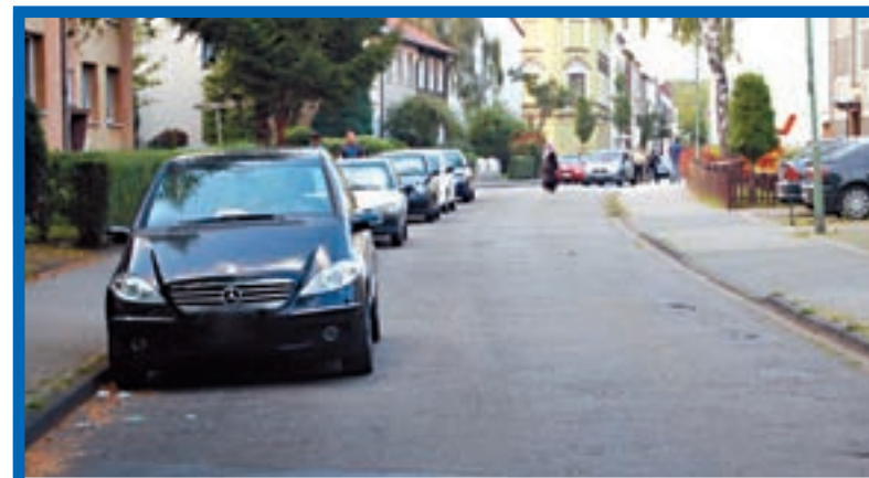
Straße Im Erlenkamp